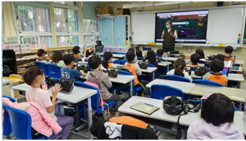
303國語『安平古堡教學參觀記』 融入平板與頭盔教學