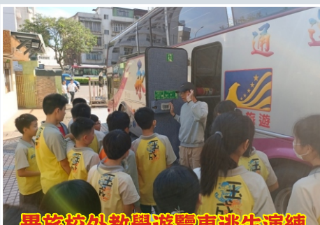
畢旅校外教學遊覽車逃生演練