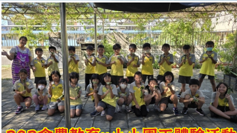
303食農教育u小小園丁體驗活動