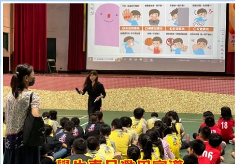
學生毒品濫用宣導