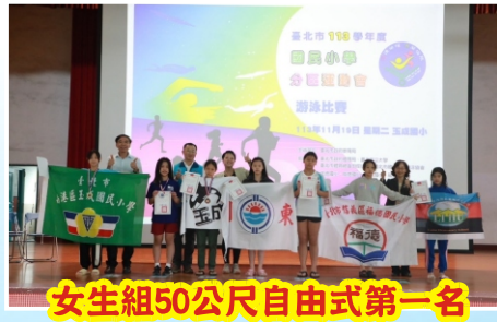
女生組50公尺自由式第一名