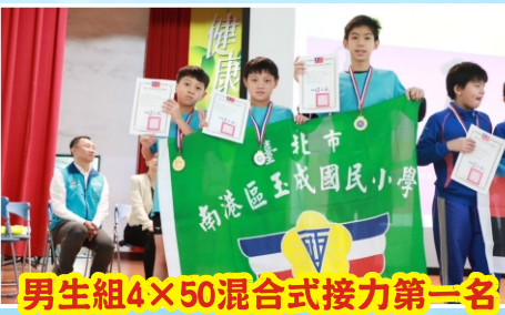
男生組4×50混合式接力第一名