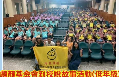
顏顏基金會到校說故事活動(低年級)