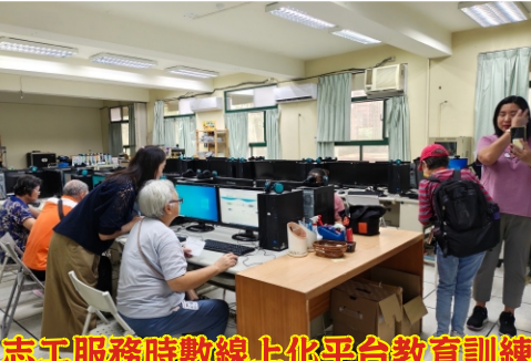
志工服務時數線上化平台教育訓練