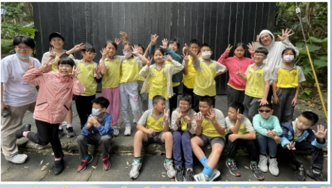
503 福音團--全班都完成降落任務啦!