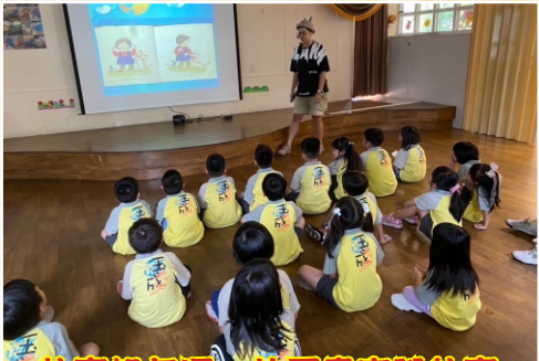
故事組每週一的圖書室說故事