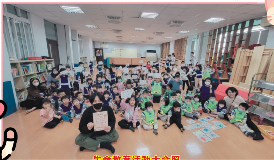
生命教育活動大合照

介紹完貓咪的各種情緒表情後，林醫生讓我們練習畫畫看貓咪的表情，並和大家分享自己畫的是貓咪的什麼情緒，活動結束後玉成附幼的大家都更加認識貓咪，也藉由理解貓咪的各種表情及行為懂得如何照顧貓咪喔！