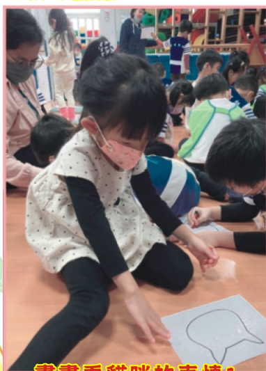
畫畫看貓咪的表情 1