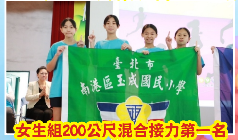
女生組200公尺混合接力第一名