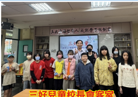
三好兒童校長會客室