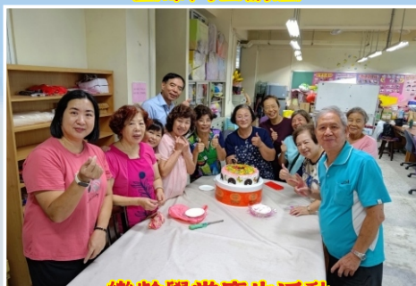
樂齡學堂慶生活動