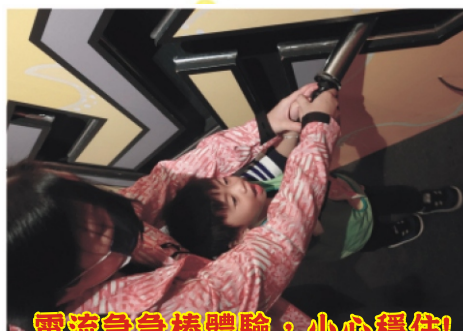
電流急急棒體驗，小心穩住！