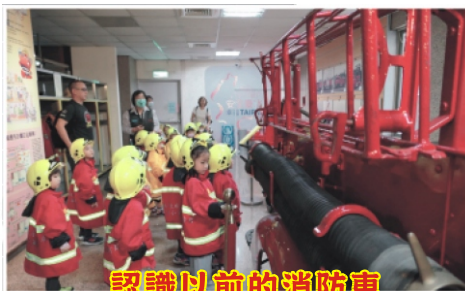
認識以前的消防車