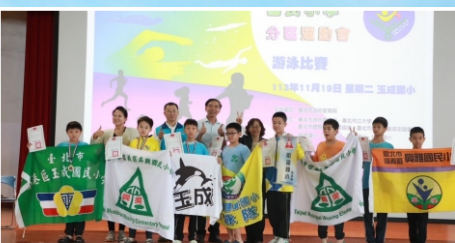
男生組200公尺自由式第一、三名