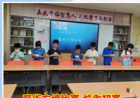
魔術方塊比賽-校內初賽