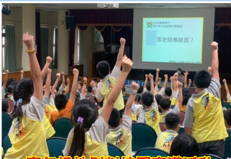
高年級性剝削校園宣導活動