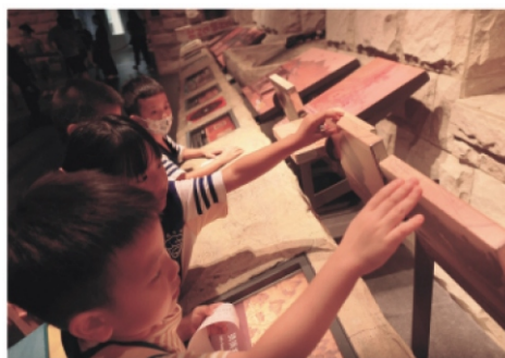
5.認識搭建台北房子的石材