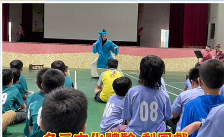
多元文化體驗-梨園戲