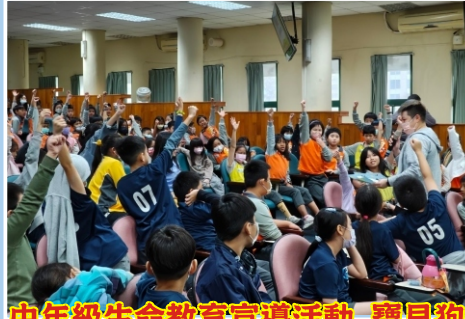
中年級生命教育宣導活動_寶貝狗