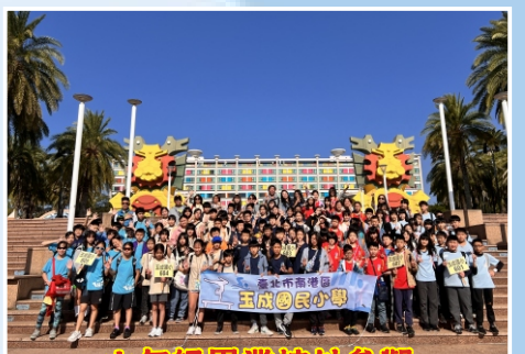
六年級畢業校外參觀