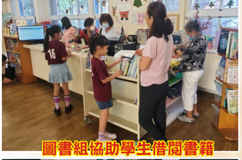
圖書組協助學生借閱書籍