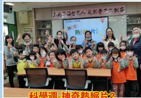
科學週-神奇熱縮片2