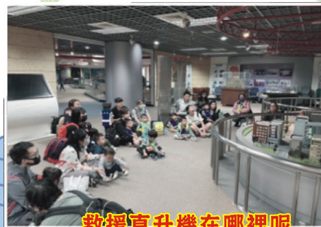
救援直升機在哪裡呢