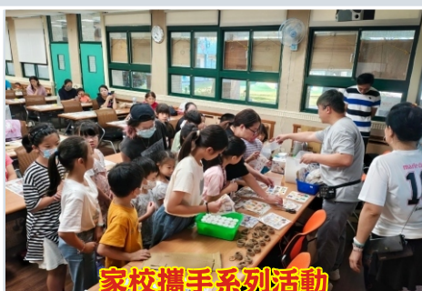
家校攜手系列活動 廣受好評的親子手作課程