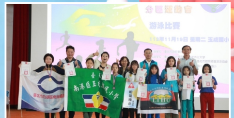
女生組200公尺自由式第二、三名