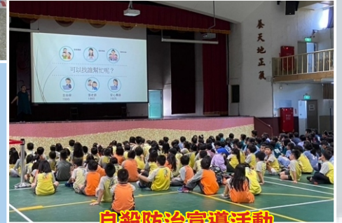
自殺防治宣導活動