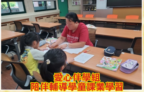
愛心伴學組 陪伴輔導學童課業學習