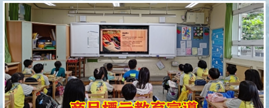
商品標示教育宣導