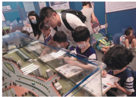
2.畫下特別的捷運站造型-「劍潭站」