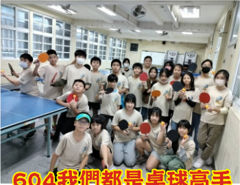
604我們都是桌球高手