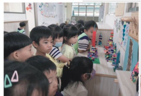
8.我們用各種積木製作台北101