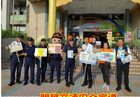
開學交通安全宣導