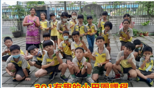
301有趣的小田園課程