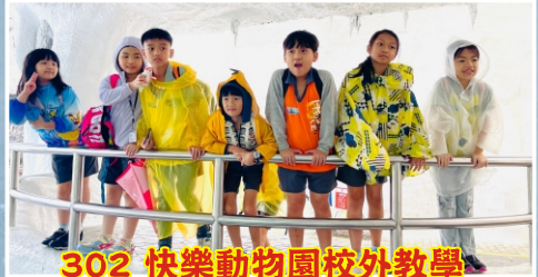
302 快樂動物園校外教學