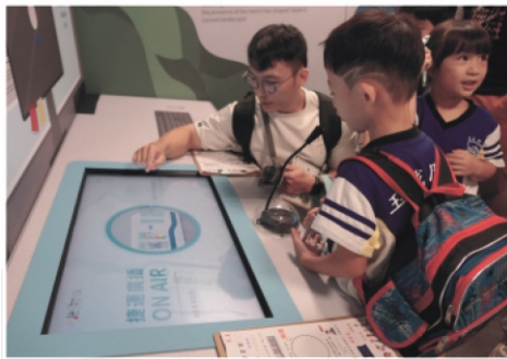
1.小小捷運廣播員體驗

回到學校後，孩子分享校外教學的經驗，並將自己有興趣的項目帶進學習區研究。用積木、樂高等各種素材蓋出101大樓以及台北動物園；用水彩或拼豆創作設計人孔蓋圖案、用黏土捏出台灣小吃.....。還有融合不同學習區資源建構松山機場，搭配飛機飛過圓山大飯店的特殊景色。在建構及討論的過程中，孩子更細部的了解台北。孩子的探索正持續進行中，我們很幸福能一起居住在這個城市，只要用心觀察和體會，生活中處處都存在著美好的細節呢！