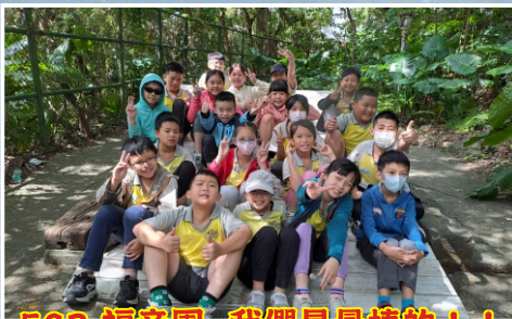
503 福音團-我們是最棒的!!