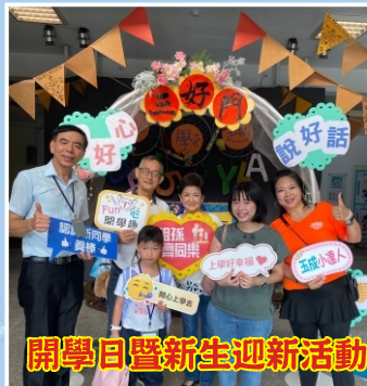
開學日暨新生迎新活動