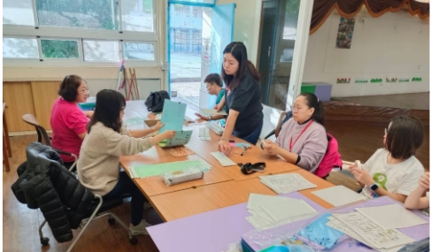
海報組支援各項活動之場地布置