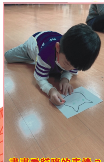
畫畫看貓咪的表情 2