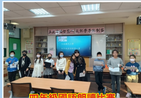
四年級國語朗讀比賽