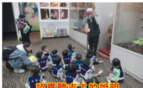
認真聽志工的說明

一樓有穿消防制服的體驗區，有各種消防隊員的制服款式外，也有小朋友可以穿的尺寸，寶貝們穿上制服，拍下帥氣可愛的樣子，看起來非常的專業投入呢！雖然因為下雨，部分的設施無法體驗，但仍是一次收穫滿滿的校外教學，期待下次我們能夠再次一起出遊喔！