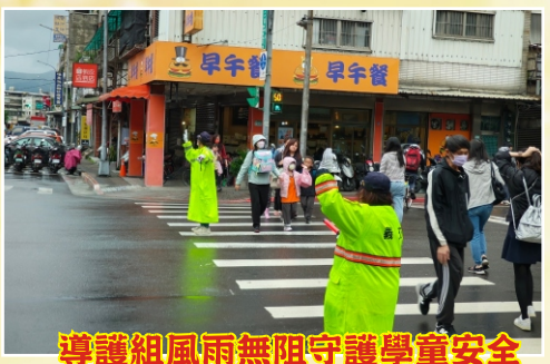
導護組風雨無阻守護學童安全