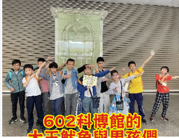
602科博館的 大王魷魚與男孩們