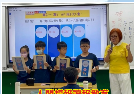
人間福報讀報教育