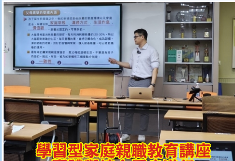
學習型家庭親職教育講座 實體與線上同步進行