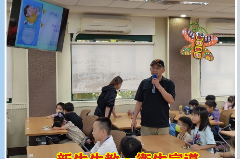
新生生教、衛生宣導