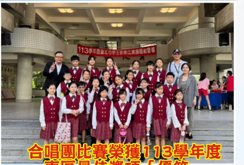
合唱團比賽榮獲113學年度東區最佳獎項「優等」