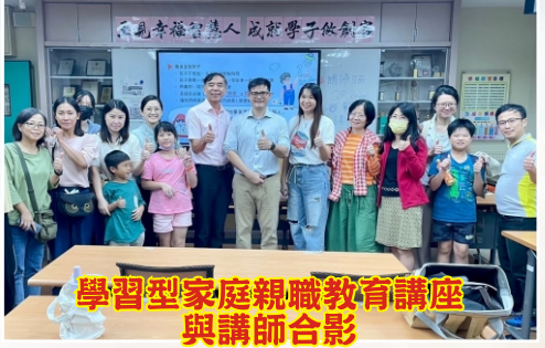
學習型家庭親職教育講座 與講師合影