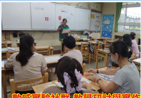
數感實驗社群 教學研討與實作