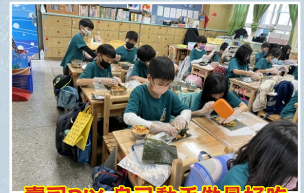
壽司DIY 自己動手做最好吃