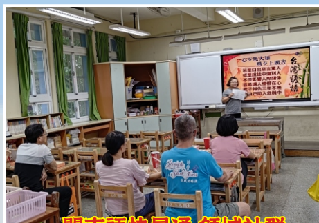
閩南語快易通 領域社群