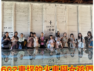
602車埋的火車與女孩們