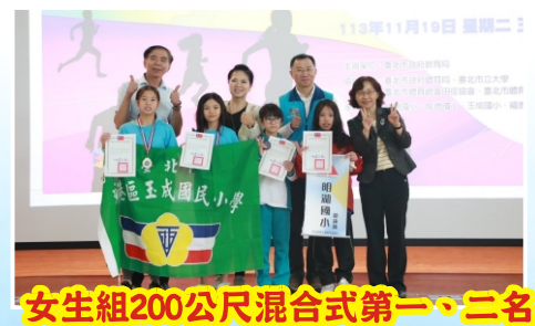
女生組200公尺混合式第一、二名