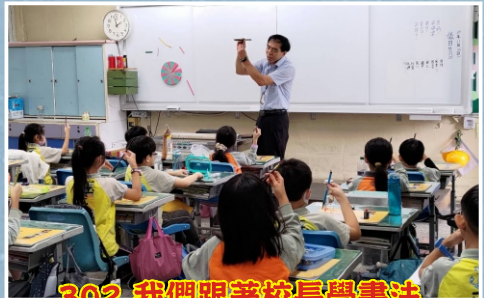
302 我們跟著校長學書法