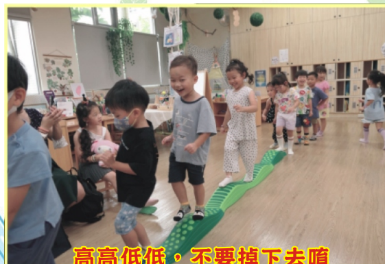
高高低低，不要掉下去喲