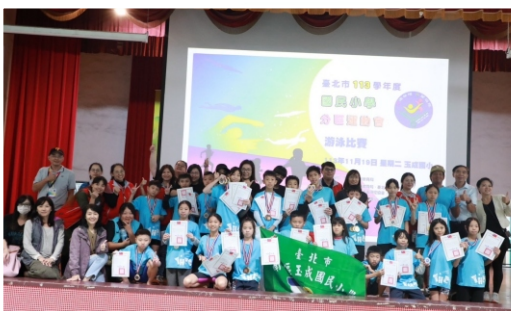
榮獲113學年度東區運動會游泳競賽 男生女生團體總錦標冠軍