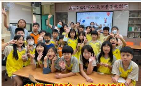
科學日體驗-神奇熱縮片