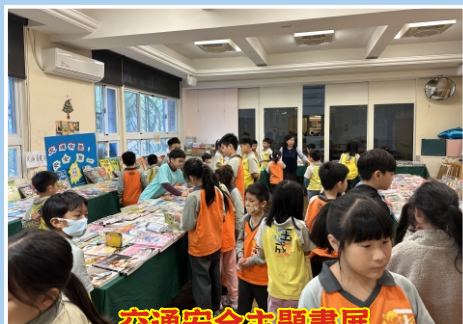
交通安全主題書展