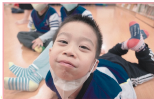
我來模仿貓咪開心的表情~