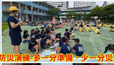
防災演練-多一分準備·少一分災害