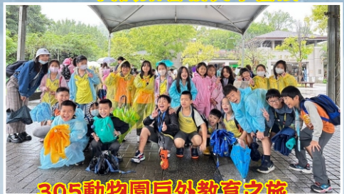
305動物園戶外教育之旅