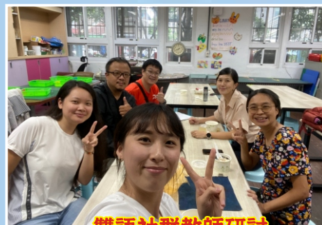
雙語社群教師研討