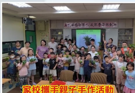
家校攜手親子手作活動 開心與作品合影