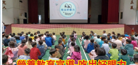
營養教育宣導-吃出好眼力