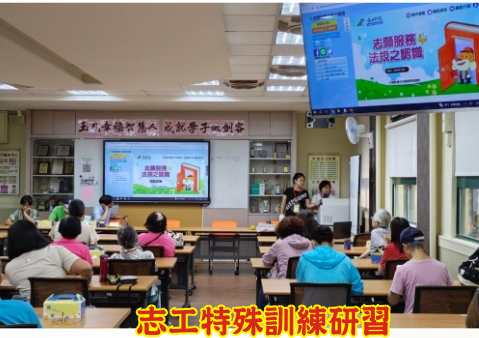
志工特殊訓練研習