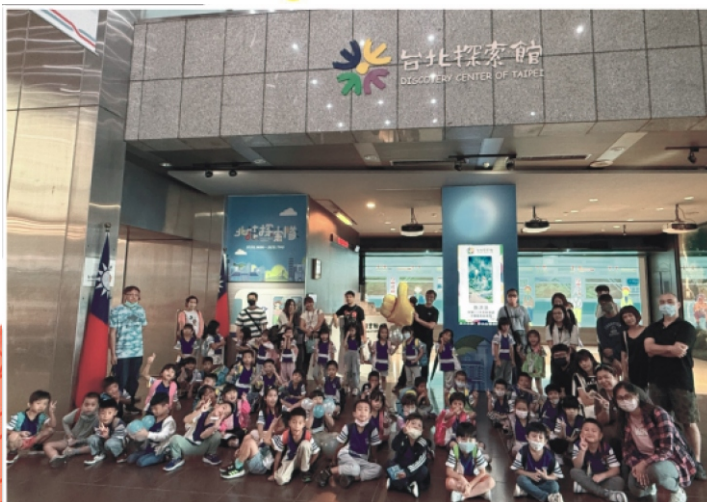
7.台北探索館大合照