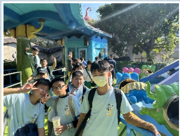
601九條好漢成功飛向藍天