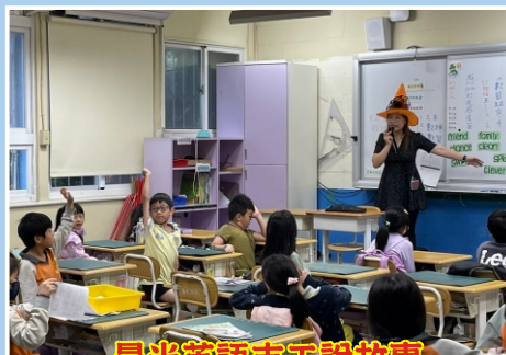
晨光英語志工說故事