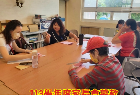
113學年度家長會募款