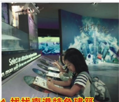
4.找找南港特色建築 -「台北流行音樂中心」