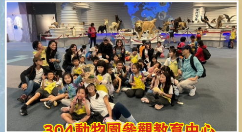
304動物園參觀教育中心