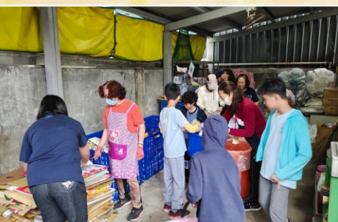
環保回收組協助學生資源回收分類