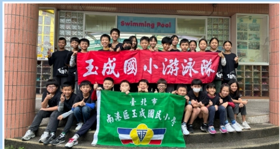
游泳隊榮獲113學年度男生女生團體總錦標冠軍