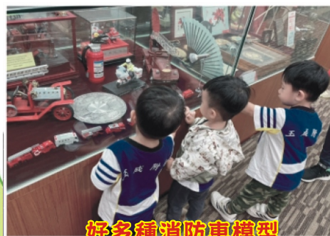
好多種消防車模型