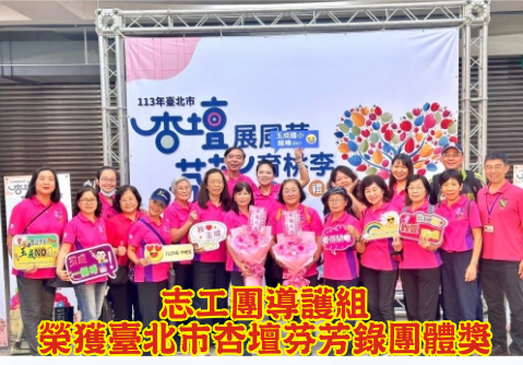
志工團導護組 榮獲臺北市杏壇芬芳錄團體獎