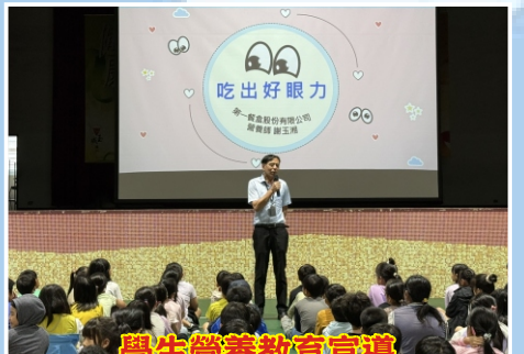
學生營養教育宣導