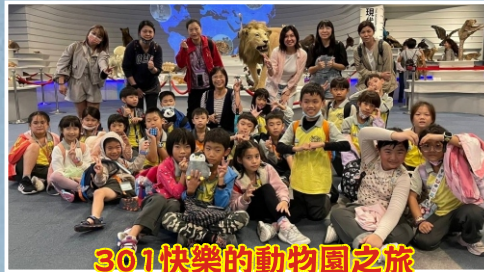
301快樂的動物園之旅