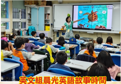
英文組晨光英語故事時間