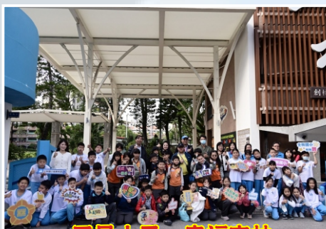
玉見士子·幸福來林 -與士林國小校際交流活動