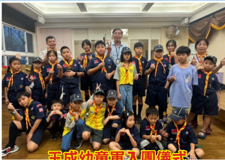
玉成幼童軍入團儀式