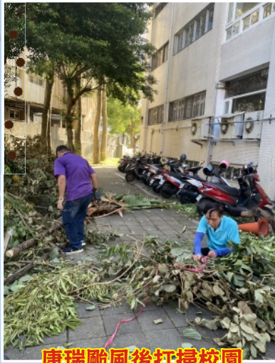
康瑞颱風後打掃校園