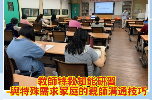
教師特教知能研習 -與特殊需求家庭的親師溝通技巧