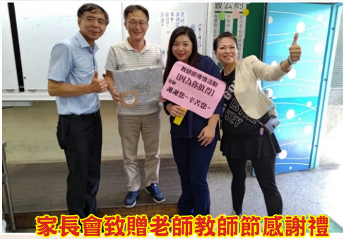
家長會致贈老師教師節感謝禮