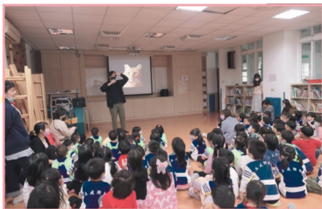
醫師介紹貓咪的臉部構造