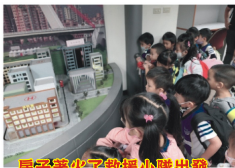
房子著火了救援小隊出發