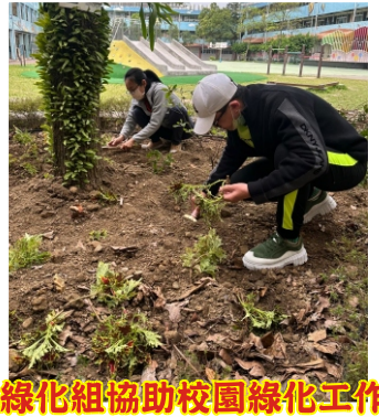
綠化組協助校園綠化工作