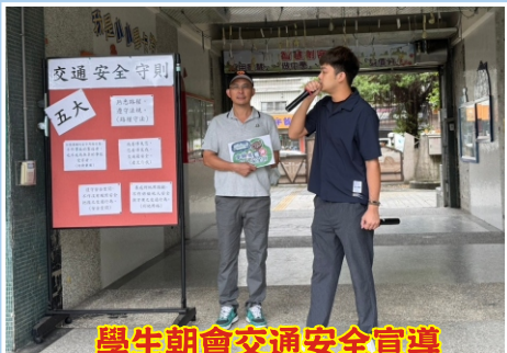
學生朝會交通安全宣導