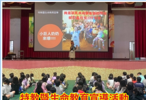
特教暨生命教育宣導活動 -生命鬥士講座