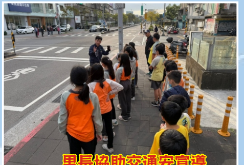
里長協助交通安宣導