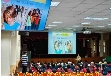
高年級情緒教育宣導活動