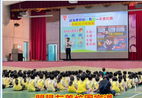
開學友善校園宣導