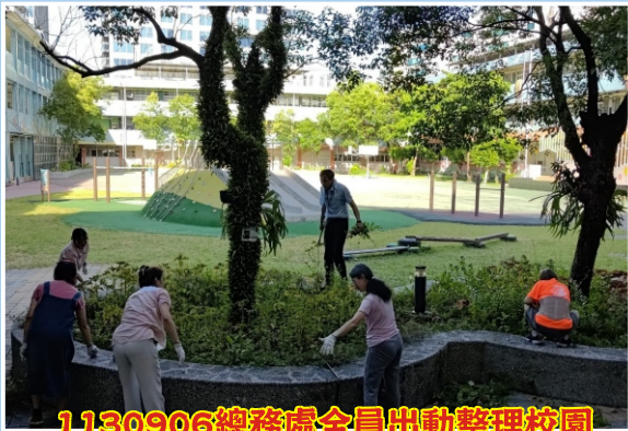
1130906總務處全員出動整理校園