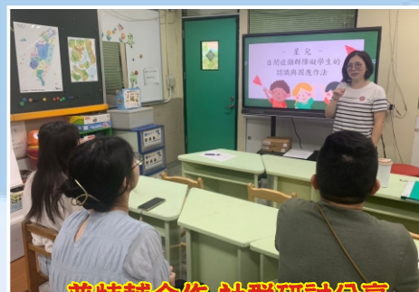
普特輔合作 社群研討分享