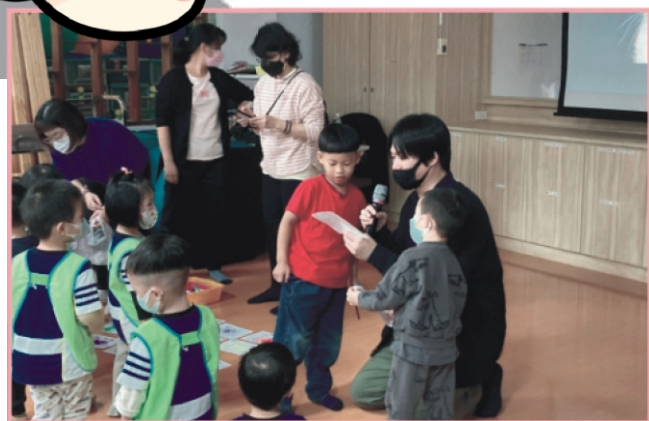
與講師分享自己畫的貓咪臉譜