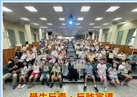
學生反毒、反詐宣導