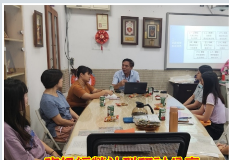
班級經營社群研討分享