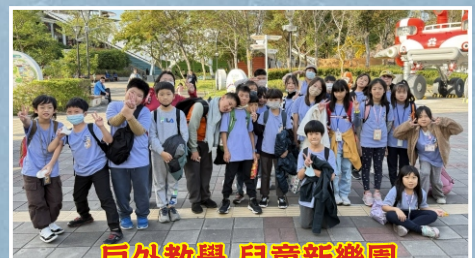
戶外教學-兒童新樂園