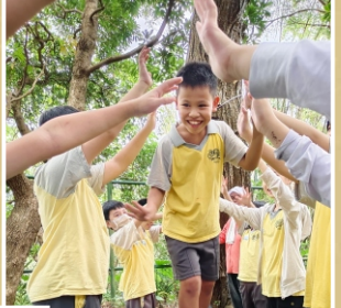
502福音團 體驗活動 過獨木橋