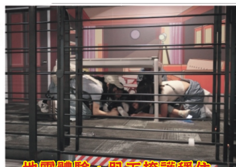
地震體驗，趴下掩護穩住