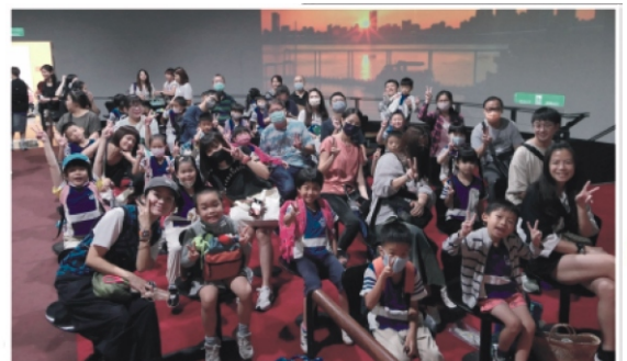
6.發現劇場觀賞「精彩夜台北」